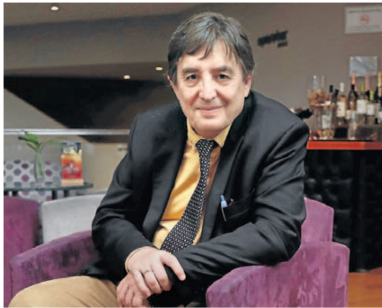
El reconocido poeta Luis García Montero, que hoy recitará en Vitoria.

Viene con ganas de conocer la catedral Santa María, en cuyo pórtico se desarrollará la cita poética. «Me hace especial ilusión conocer este sitio, que también es propicio para la intimidad, la interiorización, todo aquello que busca la poesía a la hora de sacar lo que llevamos dentro y hacerlo público con la vida de la gente», valora al hablar del remozado templo vitoriano este restaurador del lenguaje, autor de 'Las palabras rotas'. «Soy una persona convencida de que hay cosas como las palabras que no deben tener dueño y deben pertenecer a la gente. Frente a una poesía que se considera dueña de un lenguaje para poetas, lo que tenemos que hacer los poetas es tratar de dignificar y de usar de la manera más precisa posible el lenguaje de todos, lo que podemos denominar las